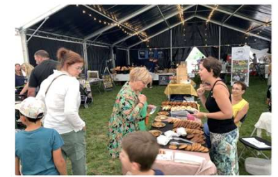
L'objectif du GAL du Pays des Quatre-Bras était de permettre les rencontres entre le monde agricole et les habitants du territoire.