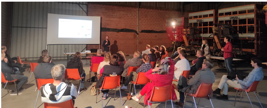
Présentation public du projet le 15/07/2021