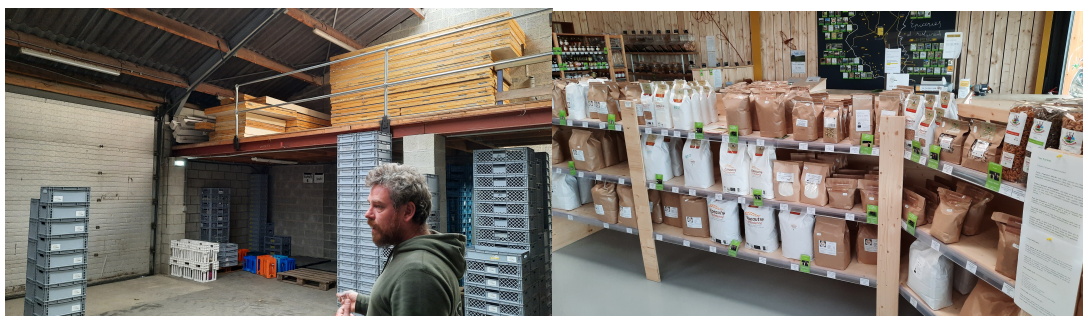
Visite Réseau Paysan