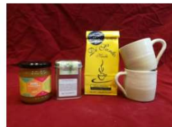
Menu Coin du feu