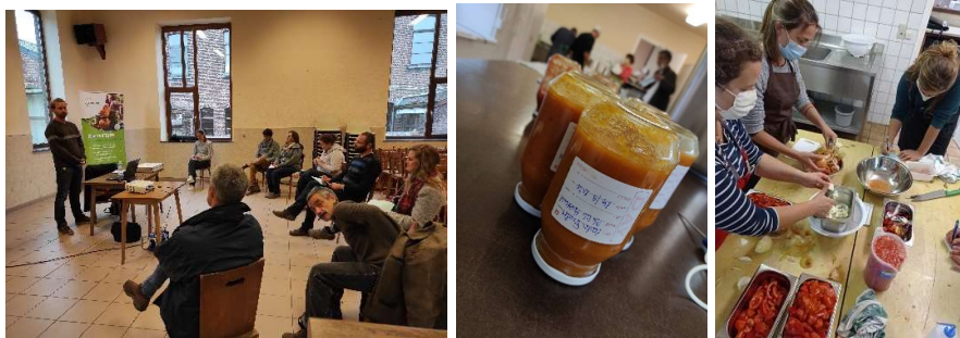
Figure 1 Formation transformation du 28/09/20

Journée coorganisée avec le GAL Culturalité qui avait comme objectif de faire découvrir l'art de la transformation des tomates et les réglementations qui entourent le processus aux professionnels. Cette formation a eu lieu dans les installations communales de Villers la Ville et a permis de toucher 2 personnes du territoire de Culturalité et 6 personnes du territoire du Pays des 4 Bras (3 maraichers installés, 2 futurs maraichers qui ont postulé à l'Espace Test et une responsable d'épicerie locale). Les participants ont trouvé la formation excellente et sont prêts à se former de nouveau (voir taux satisfaction page 28).