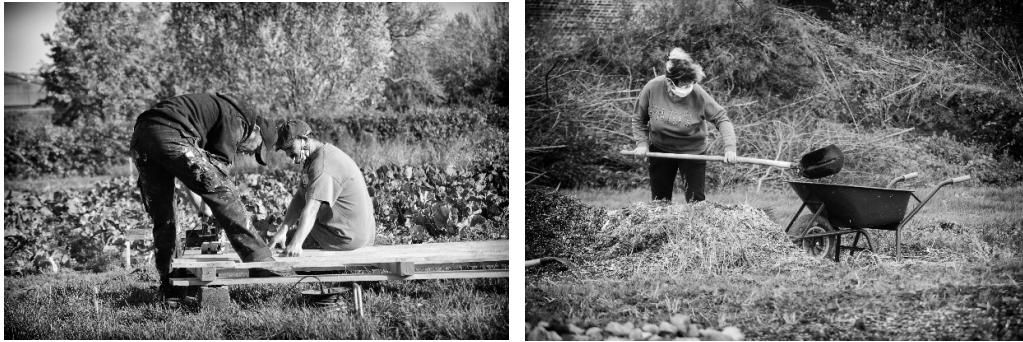
Figure 9 Permanences des Jardins d'Agricoeur