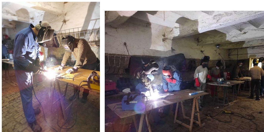
Figure 3 Formation soudure du 26/10

9 maraichers/agriculteurs (dont une personne de l'Espace Test) et un travailleur du centre culturel de Genappe suivent cette formation.