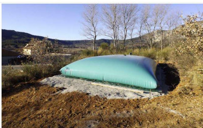
Figure 6 exemple de citerne "portefeuille"

Une grosse réflexion sur la gestion de l'eau a été menée avec des professionnels du secteur vu les difficultés rencontrées cette année (sécheresse, réserves insuffisantes, ...). La solution retenue serait d'installer une citerne « portefeuille » sur le point le plus haut du site avec un système de pompe et canalisation qui permettrait, en hiver, de récupérer l'eau de pluie des toitures des bâtiments communaux voisins vers la zone de stockage, et en été, de la zone de stockage vers les champs. Ce chantier débutera début de l'année 2021. À noter que la solution la plus simple et efficace serait de forer un puits, mais pour des raisons de pérennités et écologiques nous ne souhaitons pas aller dans cette direction.