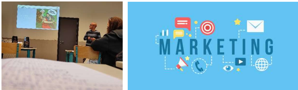
Figure 2 formation marketing du 29/09 et 06/10

2 demie journée organisées en collaboration avec Accueil Champêtre pour découvrir les bases du marketing en 2020 et de connaître les canaux de communication orienté B2C. Les 7 participants ont eu un retour très positif (voir taux de satisfaction page 28).