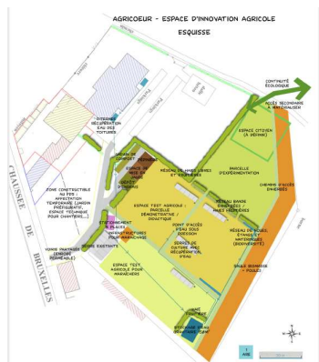
Figure 7 schéma des jardins avec les haies

en 2021. Les haies reprendront le schéma établi avec le paysagiste en début d'année tandis que les fruitiers seront placés dans la « Maille » (la parcelle d'insertion sociale) pour démontrer la faisabilité de l'agroforesterie en maraichage et d'avoir une production de fruits. Quelques plantations seront probablement réalisées début 2021.