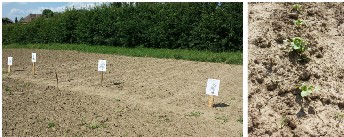
Croissance au 22/06/2020

Celles-ci devront être à maturité pour le mois de septembre pour pouvoir y effectuer des visites, notamment lors de la 2 e séance d'information sur les Plantes médicinales.